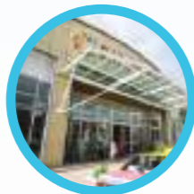
DATARAN PAHLAWAN MELAKA MEGAMALL